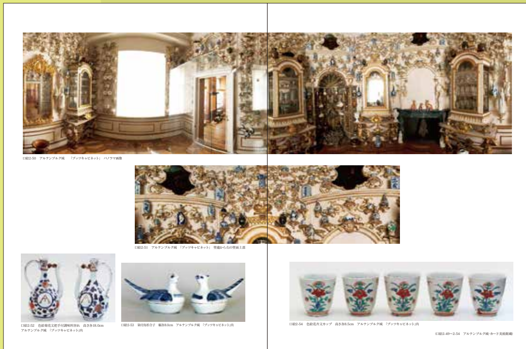
口絵42ページ、カラー図版多数収録